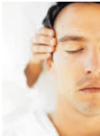
Ritual «Marco Antonio» en el Hespérides Thalasso Spa

Caroli Health Club , en colaboración con The Water Company, ofrece su tratamiento especial Día del Padre con Vermut Domingo. Vino, canela y naranja son los tres ingredientes que comparten las dos partes de esta propuesta. La primera comienza con una exfoliación a base de sales, canela y vid roja y sigue con un masaje a base de aceite de almendra dulce con aceites esenciales