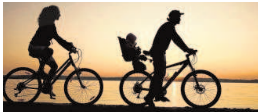
Cicloturismo en los hoteles Elba de Fuerteventura